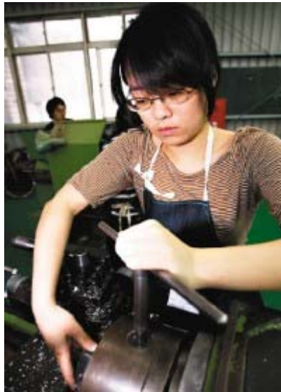
外表嬌柔的女學生，不怕髒、不怕難，跟著男同學一起使用車床與製作版模。